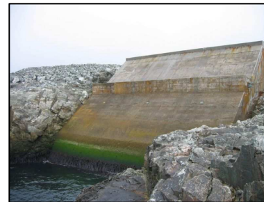
La centrale sur l'île d'Islay (Ecosse).